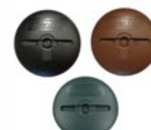
GAロゴ入り ワッシャー