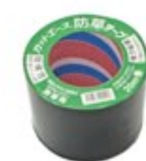
防草テープ (カッターエース)